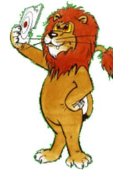
„Guschu“ - das Maskottchen der bayerischen Schützenjugend

Der Deutsche Schützenbund ist mit 1.309.009 Mitgliedern der 5. größte Sportverband Deutschlands. (Quelle: DOSB, Stand 2022) Er ist Mitglied des Deutschen Olympischen Sportbundes DOSB. Sportschießen ist in verschiedenen Disziplinen olympisch.